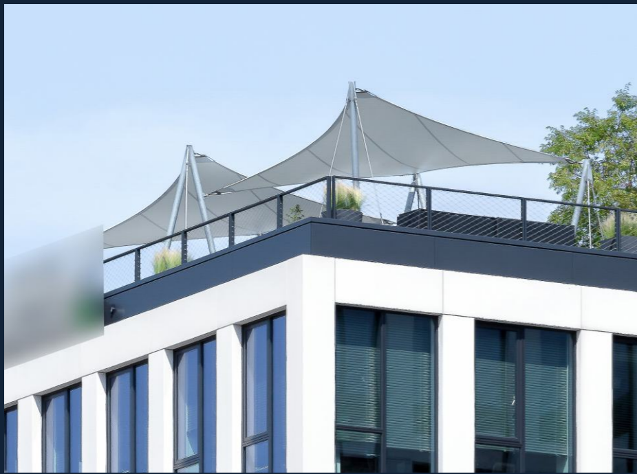
TERASA, NÁMĚSTÍ WINSTONA CHURCHILLA | TERRACE (PRAHA, CZ) MEMBRÁNOVÉ ZASTŘEŠENÍ | ROOFING 86 m 2