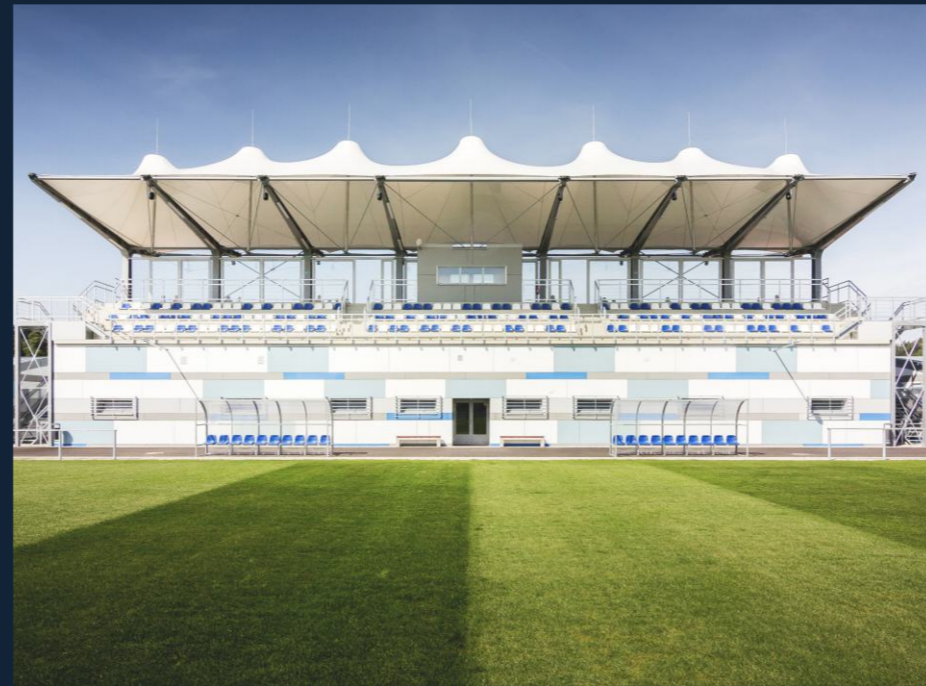
FOTBALOVÁ TRIBUNA | STADIUM STANDS (VRCHLABÍ, CZ) MEMBRÁNOVÉ ZASTŘEŠENÍ | ROOFING 330 m 2