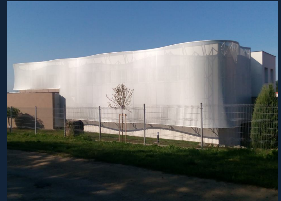
3D FASÁDA | 3D FACADE (MEDLOV, CZ) 3D FASÁDA | 3D FACADE 230 m 2

TEXTILNÍ A MEBRÁNOVÁ ARCHITEKTURA TEXTIL AND MEMBRANE ARCHITECTURE KONSTRUKCE Z FÓLIÍ ETFE ETFE MEMBRANE STRUCTURES TEXTILNÍ FASÁDY, PODHLEDY A STÍNĚNÍ TEXTIL FACADES, CEILINGS AND SHADING