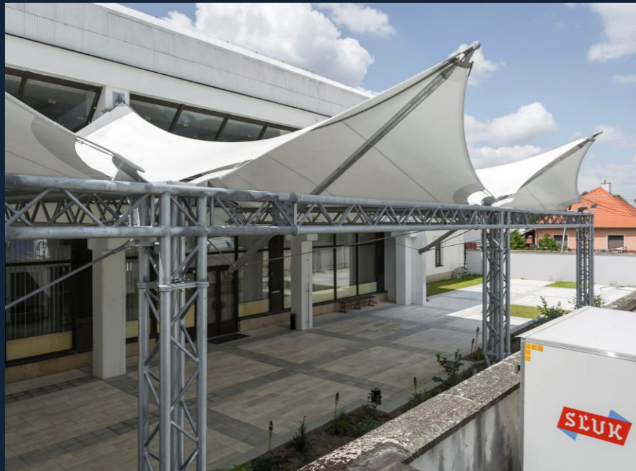
OBJEKT SLUK (BRATISLAVA - RUSOVCE, SK) MEMBRÁNOVÉ ZASTŘEŠENÍ | ROOFING 260 m 2