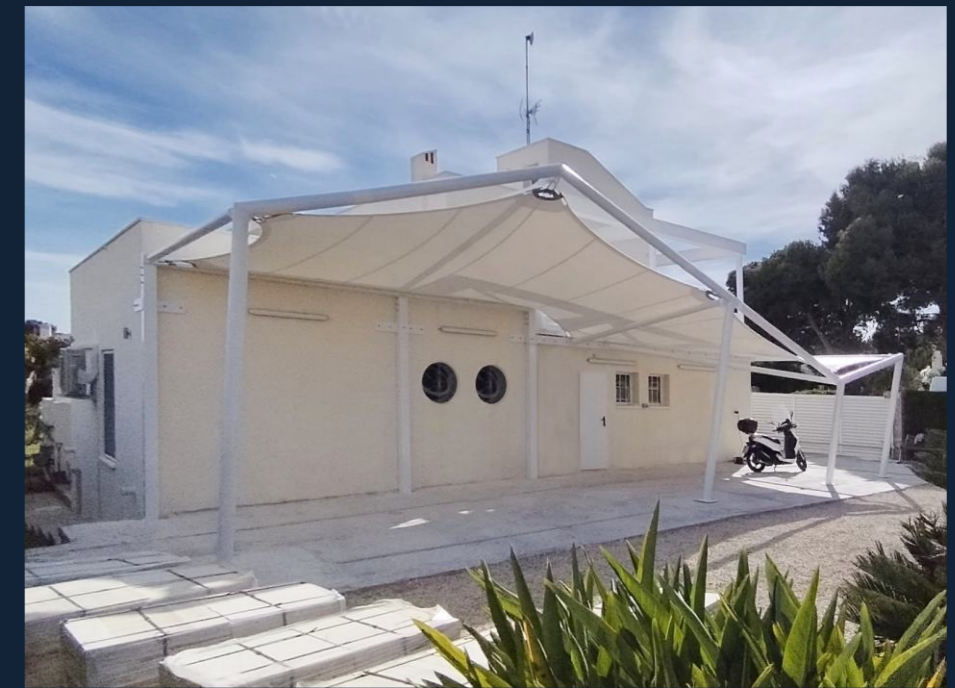
PARKOVACÍ STÁNÍ | PARKING (CALAFAT, ES) MEMBRÁNOVÉ ZASTŘEŠENÍ | ROOFING 53 m 2