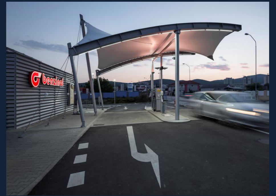
ČERPACÍ STANICE | FUEL STATION (MODRA, SK) MEMBRÁNOVÉ ZASTŘEŠENÍ | ROOFING 70 m 2