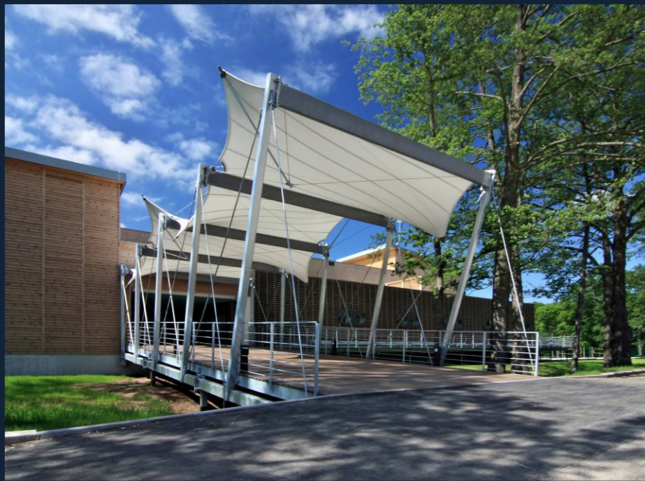
LÁVKA U VSTUPU NA KOUPALIŠTĚ | SWIMMING POOL ENTRANCE BRIDGE (HRADEC KRÁLOVÉ, CZ) MEMBRÁNOVÉ ZASTŘEŠENÍ | ROOFING 100 m 2