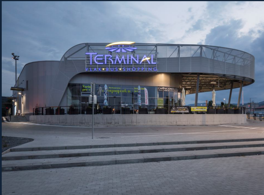
OBCHODNÍ A DOPRAVNÍ CENTRUM TERMINAL | SHOPPING AND TRANSPORT CENTER TERMINAL (BANSKÁ BYSTRICA, SK) 3D FASÁDA | 3D FACADE 1800 m 2