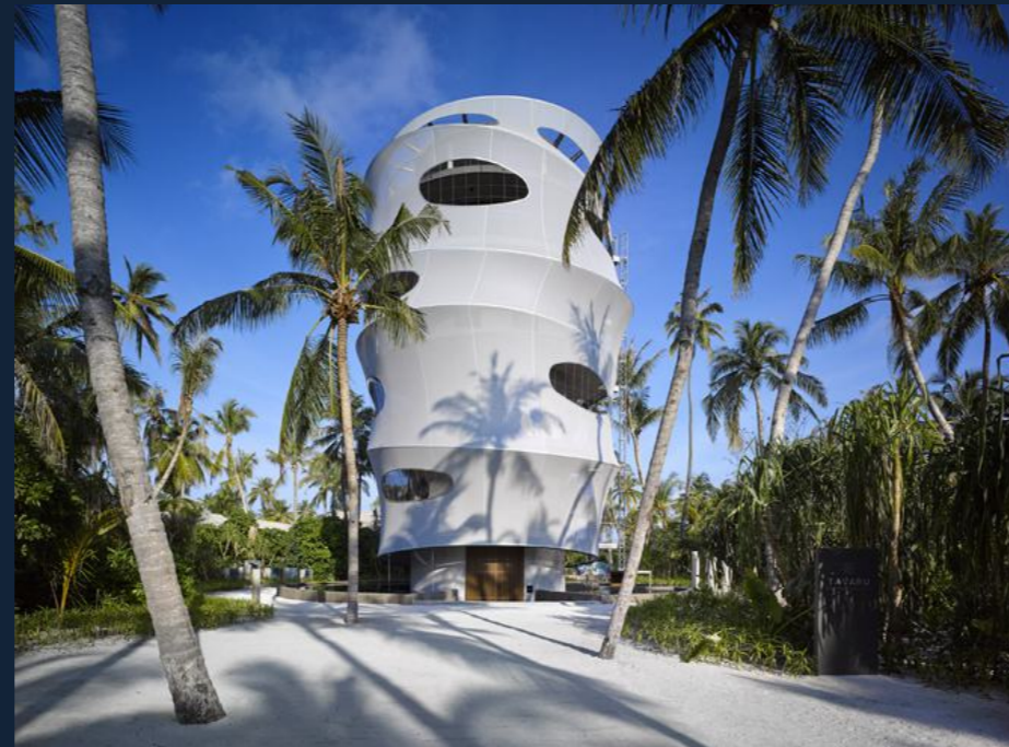
RESTAURACE TAVARU | RESTAURANT (VELAA PRIVATE ISLAND, MDV) TEXTILNÍ FASÁDA | TEXTILE FACADE NEREZOVÉ SÍŤE X-TEND® | STAINLESS STEEL MESH X-TEND® 207 m 2