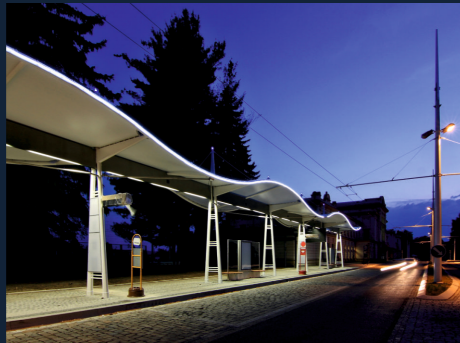
AUTOBUSOVÉ NÁDRAŽÍ | BUS TERMINAL (MARIÁNSKÉ LÁZNĚ, CZ) MEMBRÁNOVÉ ZASTŘEŠENÍ | ROOFING, 450 m 2