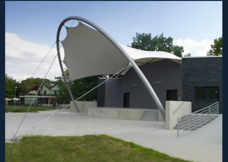
AMFITEÁTR NA BENEDIKTU | AMPHITHEATER (MOST, CZ) MEMBRÁNOVÉ ZASTŘEŠENÍ | ROOFING 225 m 2

TEXTILNÍ A MEBRÁNOVÁ ARCHITEKTURA TEXTIL AND MEMBRANE ARCHITECTURE KONSTRUKCE Z FÓLIÍ ETFE ETFE MEMBRANE STRUCTURES TEXTILNÍ FASÁDY, PODHLEDY A STÍNĚNÍ TEXTIL FACADES, CEILINGS AND SHADING