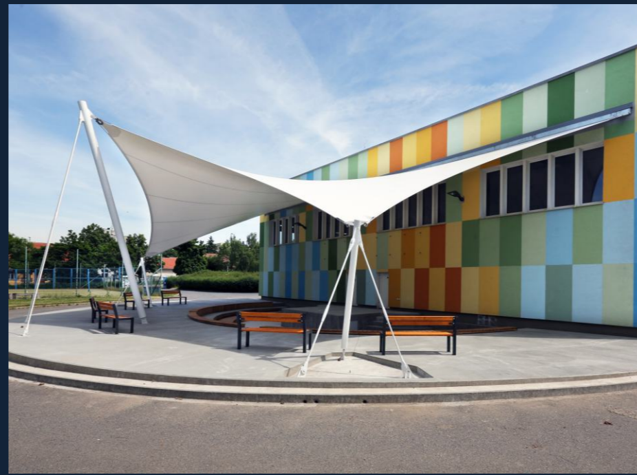
AMFITEÁTR ZŠ PETROVICE | ELEMENTARY SCHOOL (PRAHA, CZ) MEMBRÁNOVÉ ZASTŘEŠENÍ | ROOFING 207 m 2